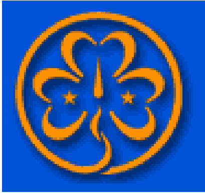
Liite 3 WAGGS tunnus