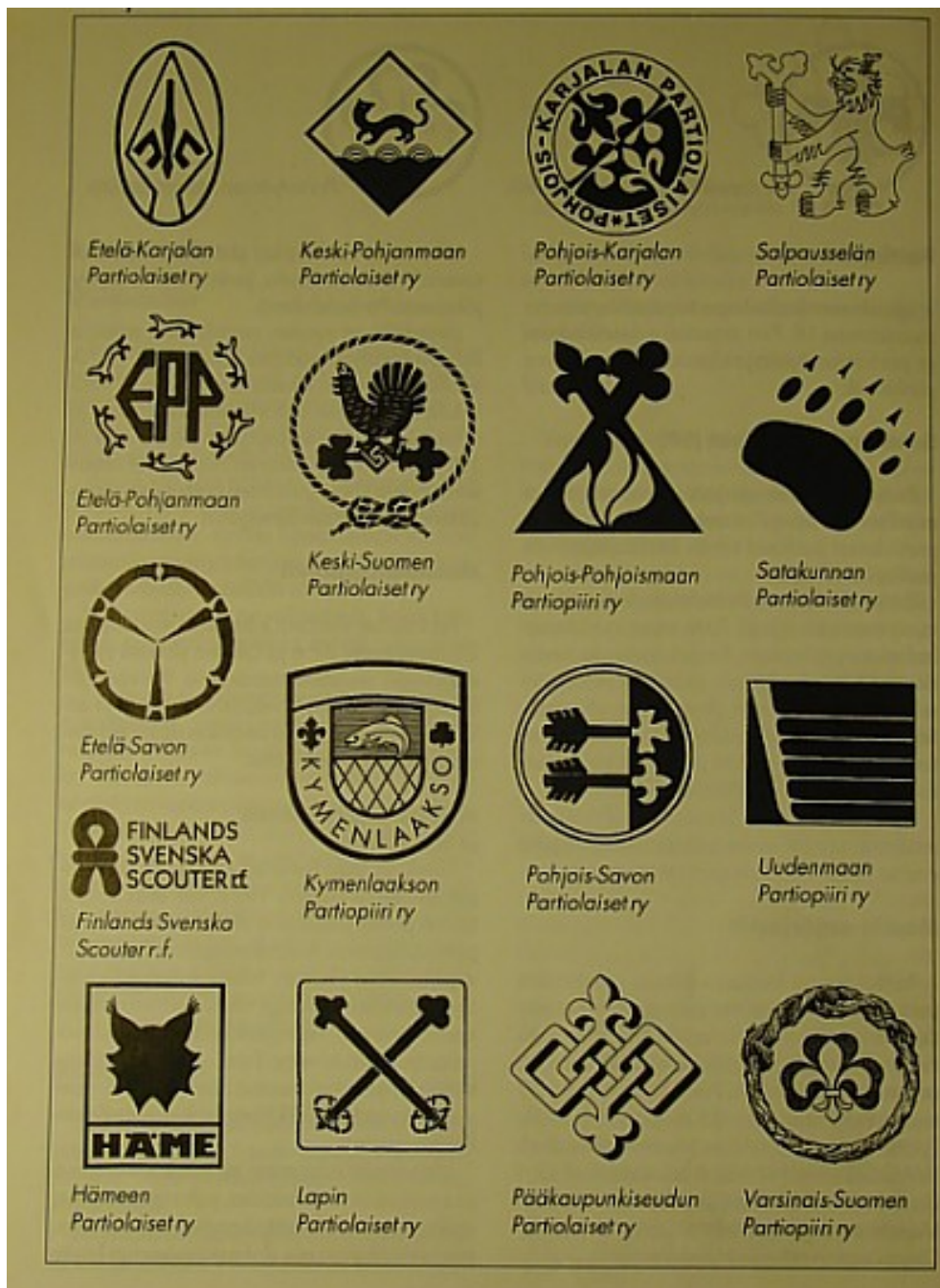
Liite 5 Partiopiirien tunnuksia