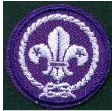
Liite 4 WOSM tunnus