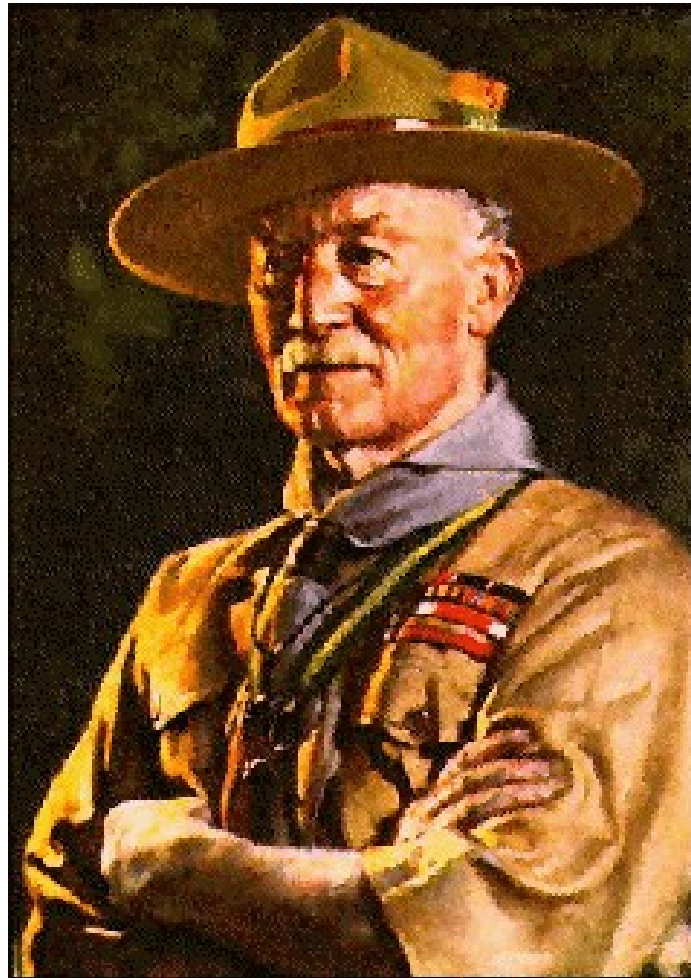
Liite 1 Kuva B-P:stä, joka paljastettiin jamboree-leirillä 1929 Arrowe Parkissa